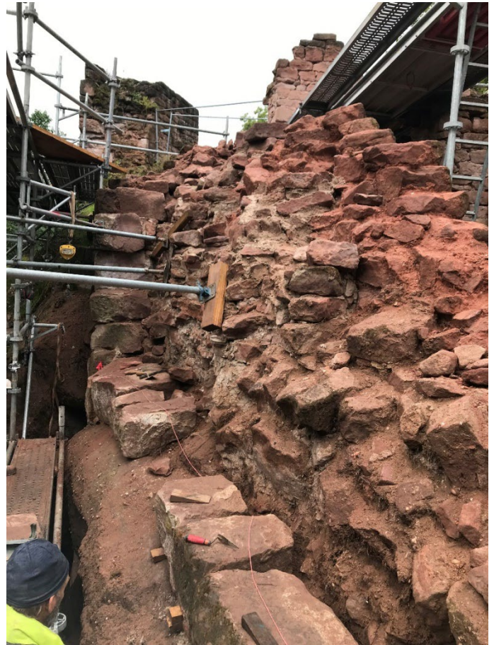
Renforcement du rocher par incorporation de tirants (travaux sous-traités à la société ROC Aménagement)