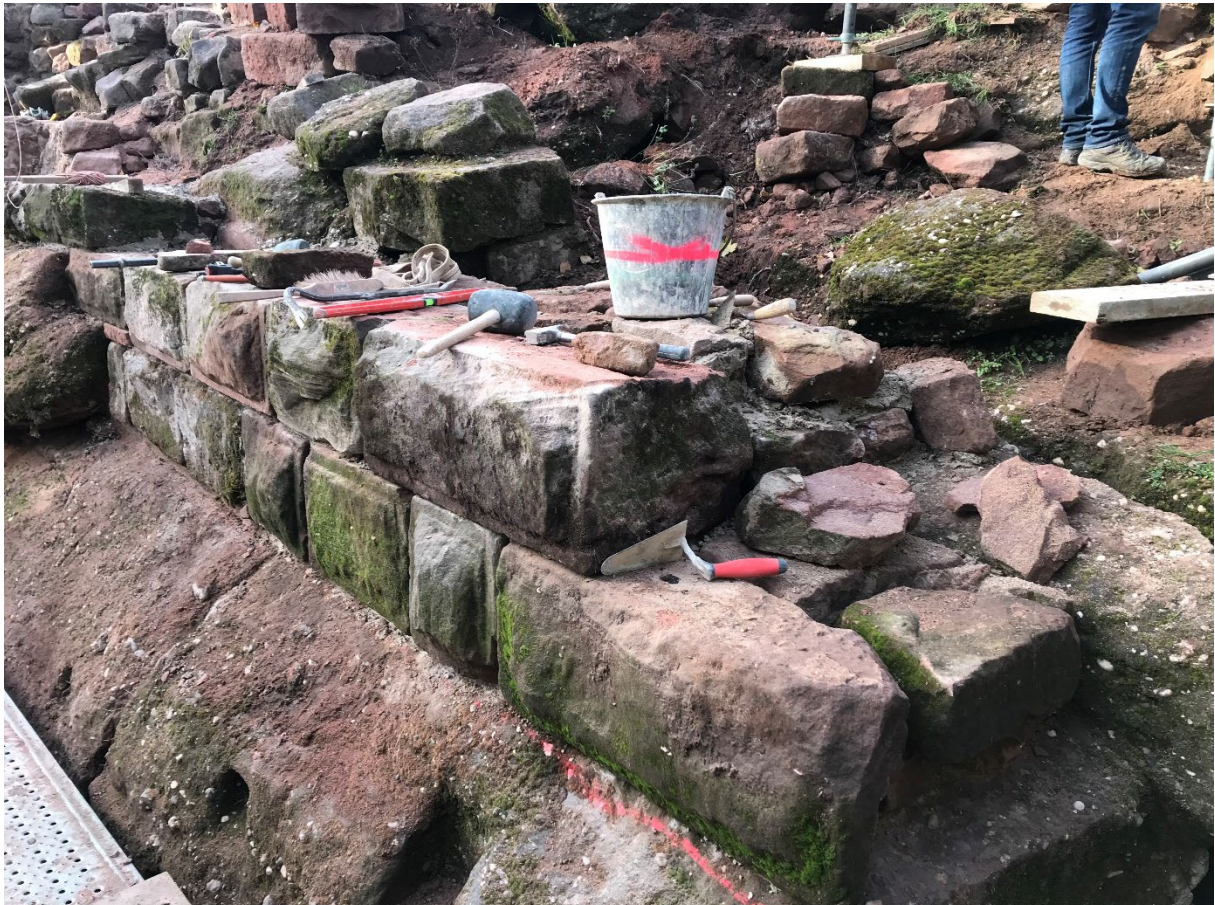
Deux assises ont été maçonnées jusqu'au rocher sapé pour rappeler la position du rempart disparu