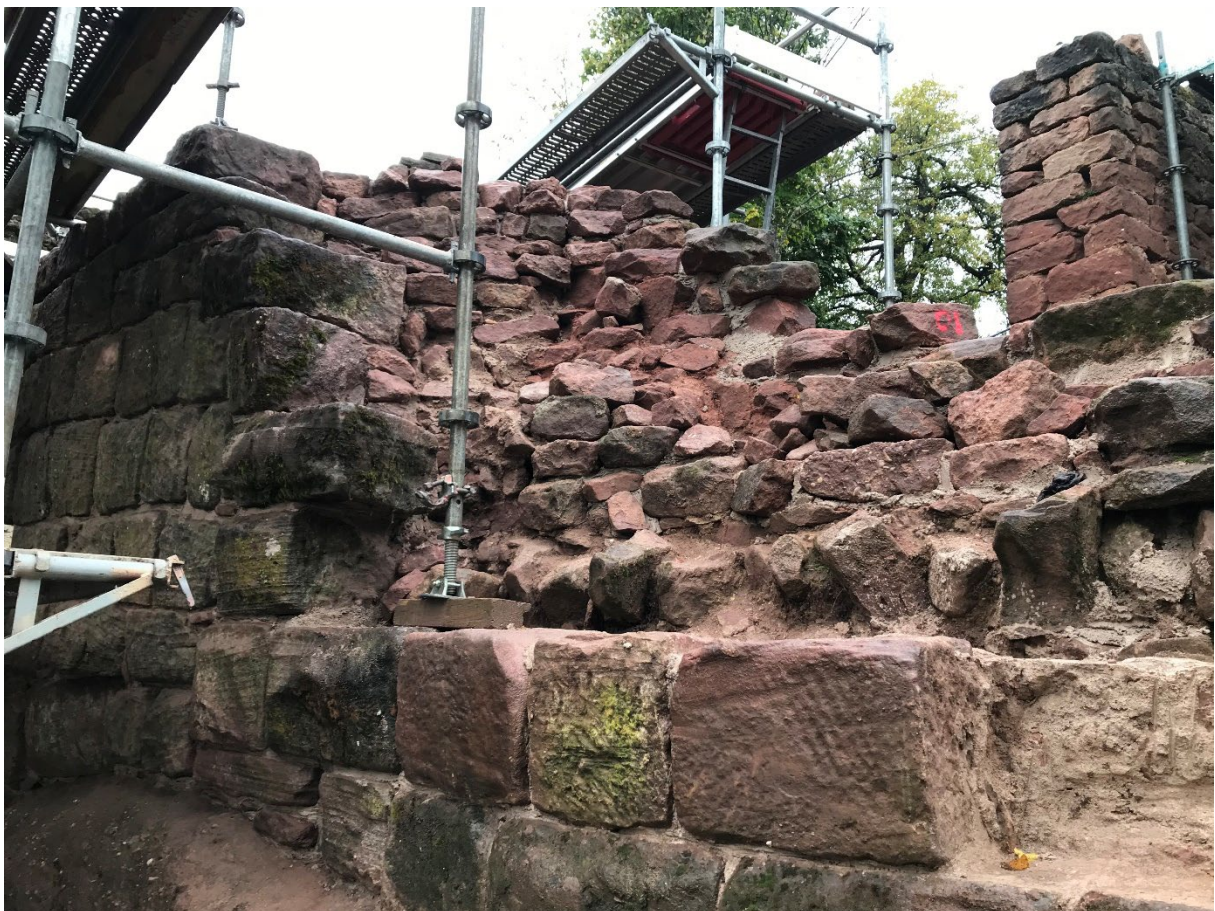
A droite et au pied du mur, dépose, compléments et repose de maçonnerie