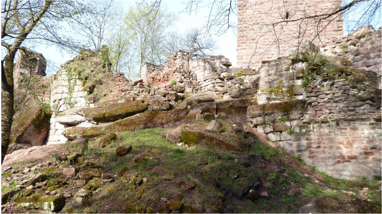
Situation avant travaux