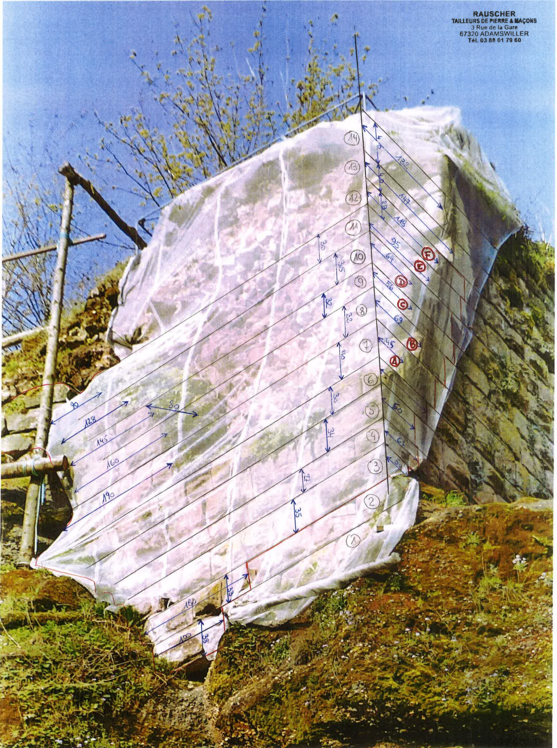
— limite de dépose du pavement

RAUSCHER TAILLEURS DE PIERRE & MAÇONS 3 Rue de la Gare 67320 ADAMSWILLER Tél. 03 88 01 79 60