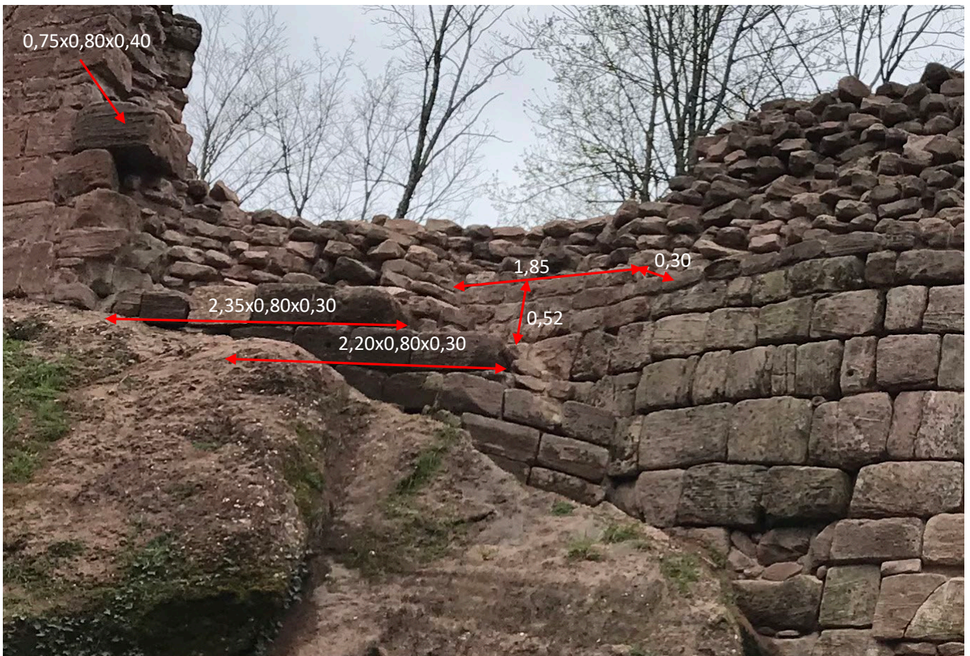
Après travaux – Photo annotée n°4