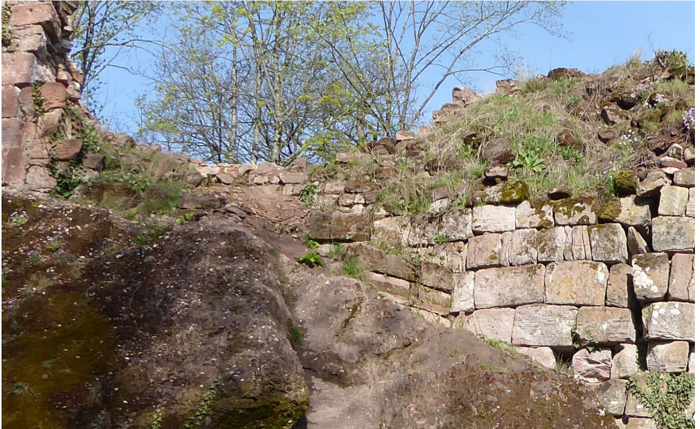
Pos. 84 et 87 – Reprise de maçonnerie désorganisée ou pose de maçonnerie en complément