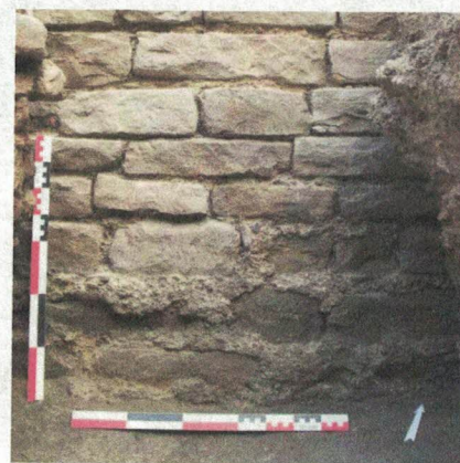
Figure 2 : détail du parement d'un mur rue des Veaux, à Strasbourg (M. Werlé, 2009)