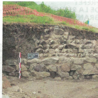
Figure 1 : chaînage d'angle d'une tour de l'Engelbourg (J. Koch, 2013)